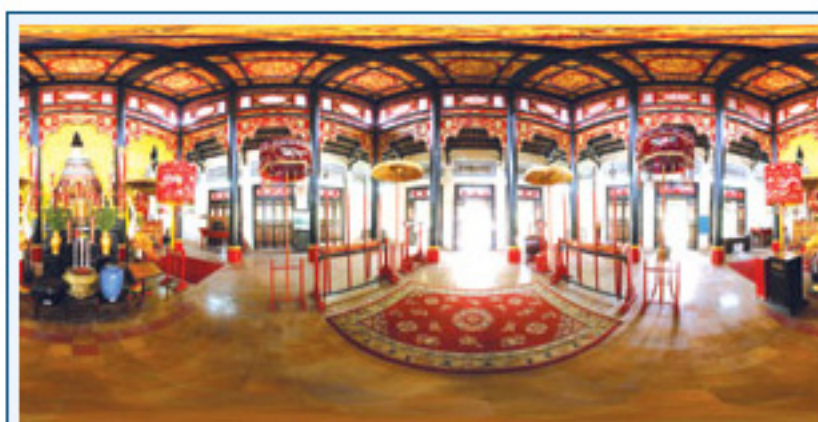
Đền Hùng dưới "ma thuật" Panorama

Lần đầu tiên tại Việt Nam, kỹ thuật này được áp dụng đối với những sáng tạo của nghệ thuật nhiếp ảnh. Để làm được điều này, người nghệ sĩ phải chụp lại nhiều kiểu ảnh khác nhau, nhưng phải khớp với tâm ảnh của góc hình trước. Đây là một đòi hỏi không dễ thực hiện vì tâm ảnh không trùng với tâm chân máy. Sau đó, các bức ảnh này được liên kết lại qua các phần mềm đặc biệt như Photoshop, Panorama maker... "Phải mất cả năm để mày mò các ứng dụng này nhưng khi đã thao tác được thì mê lắm!"- Trần Thanh Sang tâm sự. Với chiếc máy ảnh kỹ thuật số Canon EOS5D và ống kính góc rộng Fisheyes, để có thời gian rảnh, anh lại rong ruổi đến các địa danh nổi tiếng để thử nghiệm, sáng tạo. Chưa kể đến lao động của người nghệ sĩ, số tiền mà anh đầu tư cho các tác phẩm độc đáo này đã lên đến hơn trăm triệu. Anh chia sẻ: "Mong ước của tôi là mọi người đều được chiêm ngưỡng vẻ đẹp Việt Nam". Cũng chính vì điều này mà anh xây dựng trang web mang tên mình.