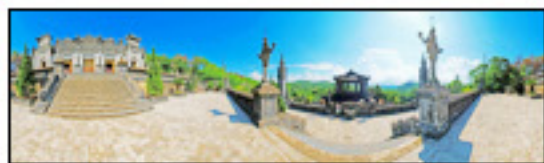
Lăng Khải Định - Huế

Làm sao để quảng bá hình ảnh Việt Nam nhiều hơn nữa với bạn bè quốc tế? Làm sao để những hình ảnh đất mẹ phải sống động, mới mẻ, quyến rũ chứ không lặp lại những cảm xúc đơn điệu? Từ lâu rồi nhiếp ảnh gia Trần Thanh Sang đã dành trọn sự tìm tòi và đam mê của mình để vượt qua những câu hỏi đó với mong muốn được góp một phần nhỏ bé vào việc "tiếp thị" hình ảnh Việt Nam.