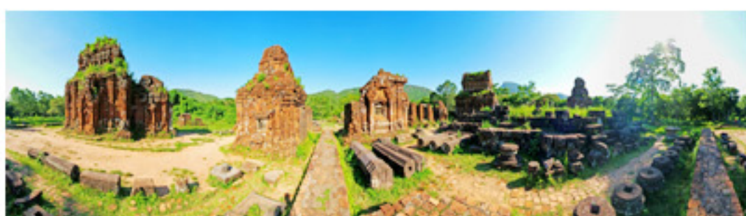
Thánh địa Mỹ Sơn

Những tấm ảnh panorama của Trần Thanh Sang đã đem lại cho người xem một cảm giác sống động và thích thú. Để có một bức panorama 360 độ của thánh địa Mỹ Sơn, lăng Khải Định, Ngọ Môn... Trần Thanh Sang tiết lộ rằng anh phải chụp rất nhiều tấm ảnh khác nhau, mỗi tấm là mỗi chi tiết, góc nhìn đặc trưng của thắng cảnh. Sau đó, bằng cách ứng dụng các phần mềm xử lý Trần Thanh Sang đã ghép những tấm ảnh trên thành những bức ảnh panorama 360 độ thật "hoàn chỉnh". Phải nói rằng những di tích, danh lam thắng cảnh đã quyến rũ và lộng lẫy hơn nhiều qua những bức ảnh của Trần Thanh Sang.